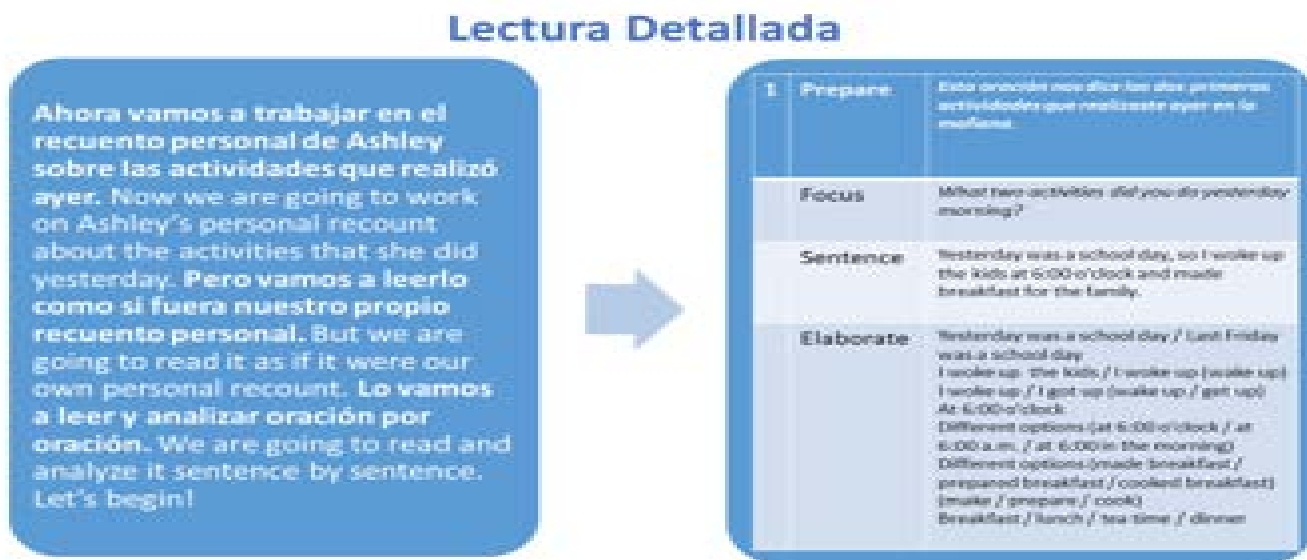
Figura 3 Lectura detallada en el taller de recuentos personales Reescritura conjunta

En el paso de reescritura conjunta, docentes y estudiantes reconstruyeron colectivamente el texto a partir de palabras y expresiones seleccionadas durante la lectura detallada. Este paso permitió reforzar la organización textual del género discursivo y promover la reflexión metalingüística, con apoyo constante del docente.