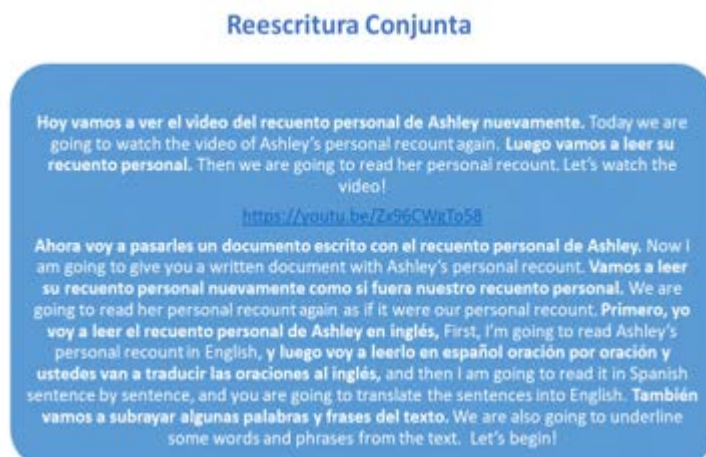
Figura 4 Reescritura conjunta en el taller de recuentos personales

En el paso de reescritura conjunta, docentes y estudiantes reconstruyeron colectivamente el texto a partir de palabras y expresiones seleccionadas durante la lectura detallada. Este paso permitió reforzar la organización textual del género discursivo y promover la reflexión metalingüística, con apoyo constante del docente.