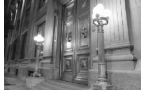
Valoración de Instituciones autónomas