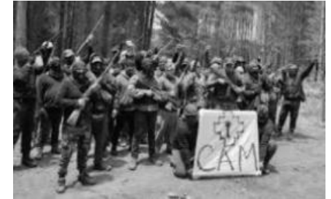
Existencia de organizaciones que practican la violencia