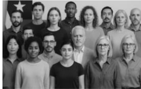
Libertad de asociación